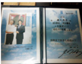
金メダリストから 直伝にメンタルを学び 最後まであきらめない宣言！