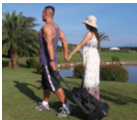
起業した日 (妻の誕生日の5月6日)に 「俺について来い！」 というテーマで撮影